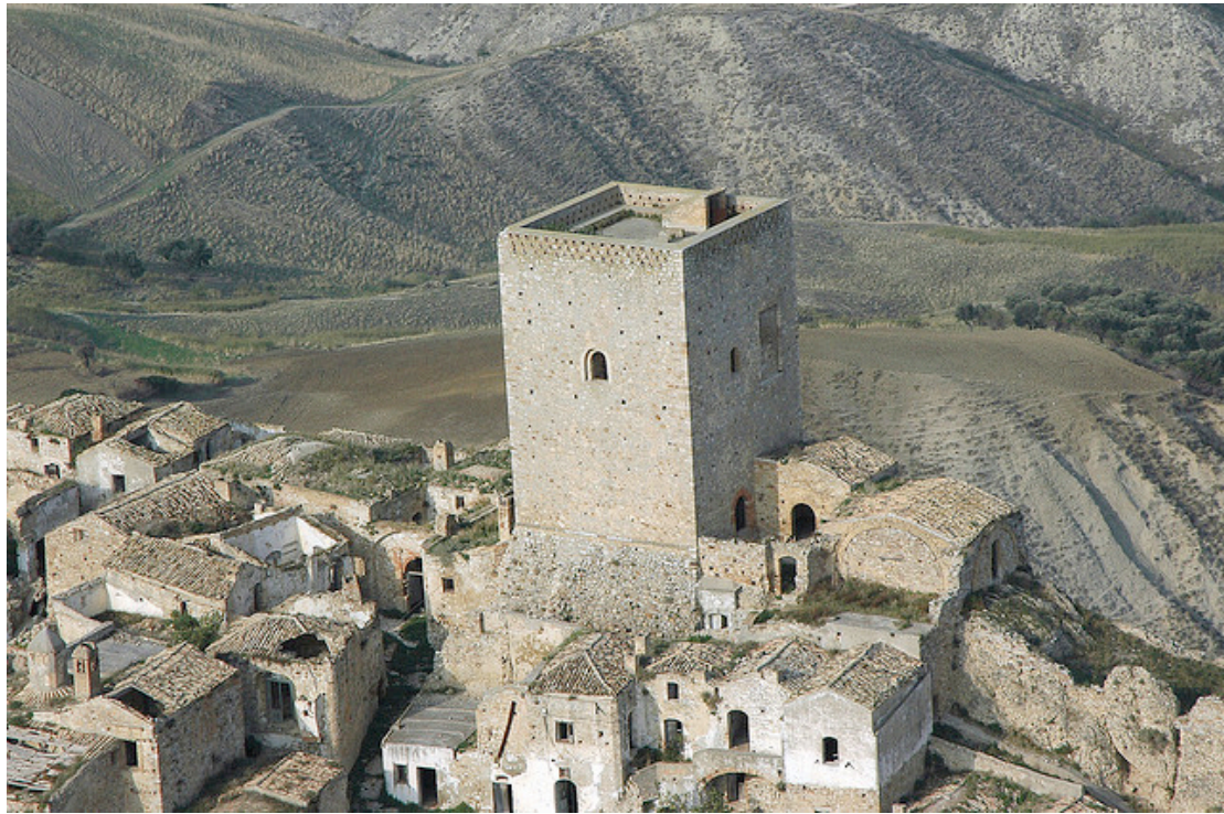
La Torre normanna di Craco

di pietra mica, coperta con canali 21 di creta, e con primo, e secondo ordine, ed alcune poche con terzo ordine, e con qualche disegno d'architettura, e vengono divise con più strade, vichi, quali sono penninose, brecciose, e fangose, e terra aperta, e senza difesa alcuna.